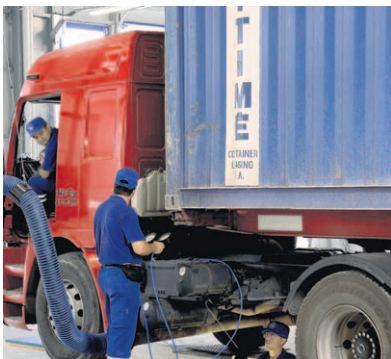
Mitarbeiter des türkischen TÜVs überprüfen einen LKW.