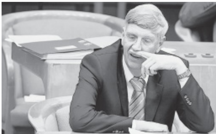
Kein Näschen für Verfassungsfragen: NRW-Innenminister Ingo Wolf (FDP) kassierte erneut eine höchstrichterliche Ohrfeige.

Gegen den jetzt gewählten Kommunalwahltermin 30. August erhebt die Opposition bereits neue verfassungsrechtliche Bedenken und verweist auf ein Gutachten des Kölner Verwaltungsrechtlers Frank Bätge. Danach ist es aus Rechtsgründen geboten, Kosten zu sparen und eine hohe Wahlbeteiligung anzustreben – ein klares Votum für den 27. September, wenn auch der Bundestag gewählt wird.