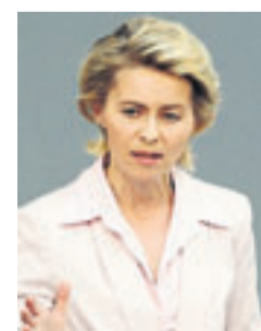
Ministerin Ursula von der Leyen.

Elena stand von Beginn an unter einem unglücklichen Stern. Zehn Jahre wurde an dem System gewerkelt, immer wieder soll es zwischen Behörden zu Kompetenzstreitigkeiten gekommen sein. Das Ziel der Entbürokratisierung blieb auf der Strecke. So rechnete der Deutsche Städte- und Gemeindebund vor, dass Wohngeldempfänger bei einem Vollbetrieb von Elena viel häufiger zum Sozialamt laufen müssten als bisher. Dann explodierten auch noch die Kosten. Der Nationale Normenkontrollrat bezifferte den Mehraufwand für die Verwaltung auf 82