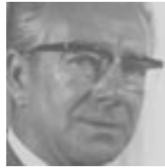
Otto Brenner 1968

»Nicht Ruhe, nicht Unterwürfigkeit gegenüber der Obrigkeit ist die erste Bürgerpflicht, sondern Kritik und ständige demokratische Wachsamkeit.«