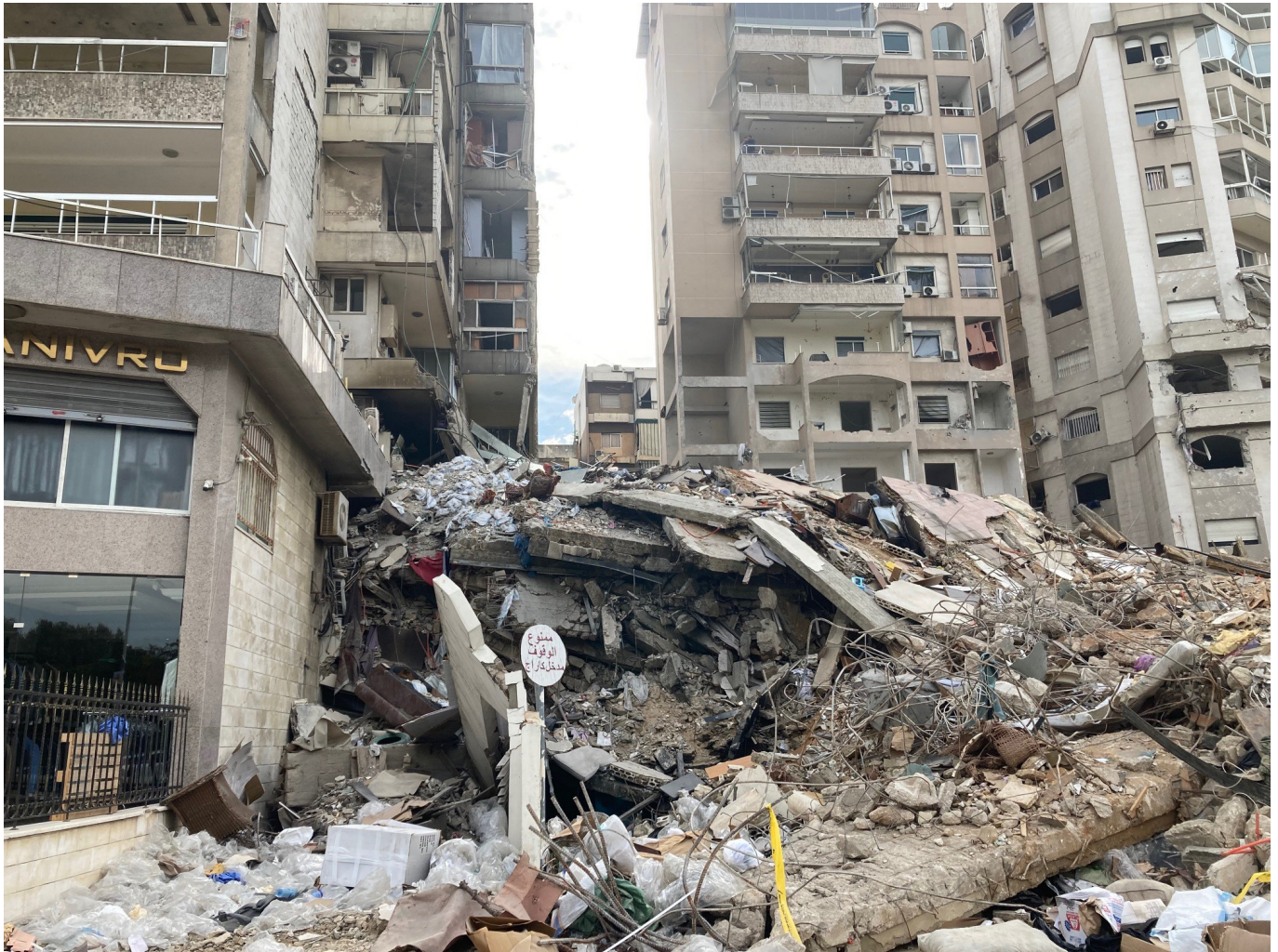
Jedes Haus, das zerstört wird, hat im Umkreis bis zu acht weitere Häuser, die durch die Explosion beschädigt oder unbewohnbar gemacht werden.

Die Kindergärten in den Lagern seien weitgehend verschont geblieben, sagt Frau Maha. Lediglich im Lager Rashidiyeh im Süden des Landes, bei Tyros, habe es Schäden am Dach und an den Fenstern gegeben. Sie zeigt Fotos auf ihrem Handy. Teile der Decke sind heruntergefallen, die Fenster bestehen aus dicken Glasbausteinen und weisen starke Risse auf. „Niemand wurde verletzt, alle waren evakuiert worden“, sagt Frau Maha. Doch nun sei es schwierig, die Fenster zu ersetzen. Glas muss importiert werden und der Preis für Glas hat sich – auch wegen der enormen Nachfrage – mit dem Tag der Waffenruhe vervierfacht. Die stabilen Glasbausteine seien derzeit gar nicht zu haben.