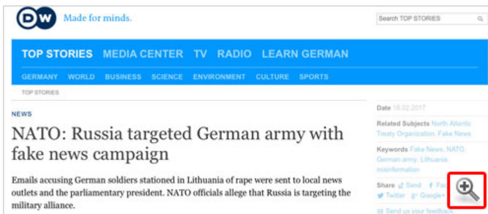
Deutsche Welle (ein deutscher Staatssender)

NachDenkSeiten - Fake-News im Quadrat - SPIEGEL Online hat selbst Fake-News zu einer angeblichen russischen Fake-News-Kampagne gegen die Bundeswehr in Litauen in Umlauf gebracht | Veröffentlicht am: 18. April 2017 | 5