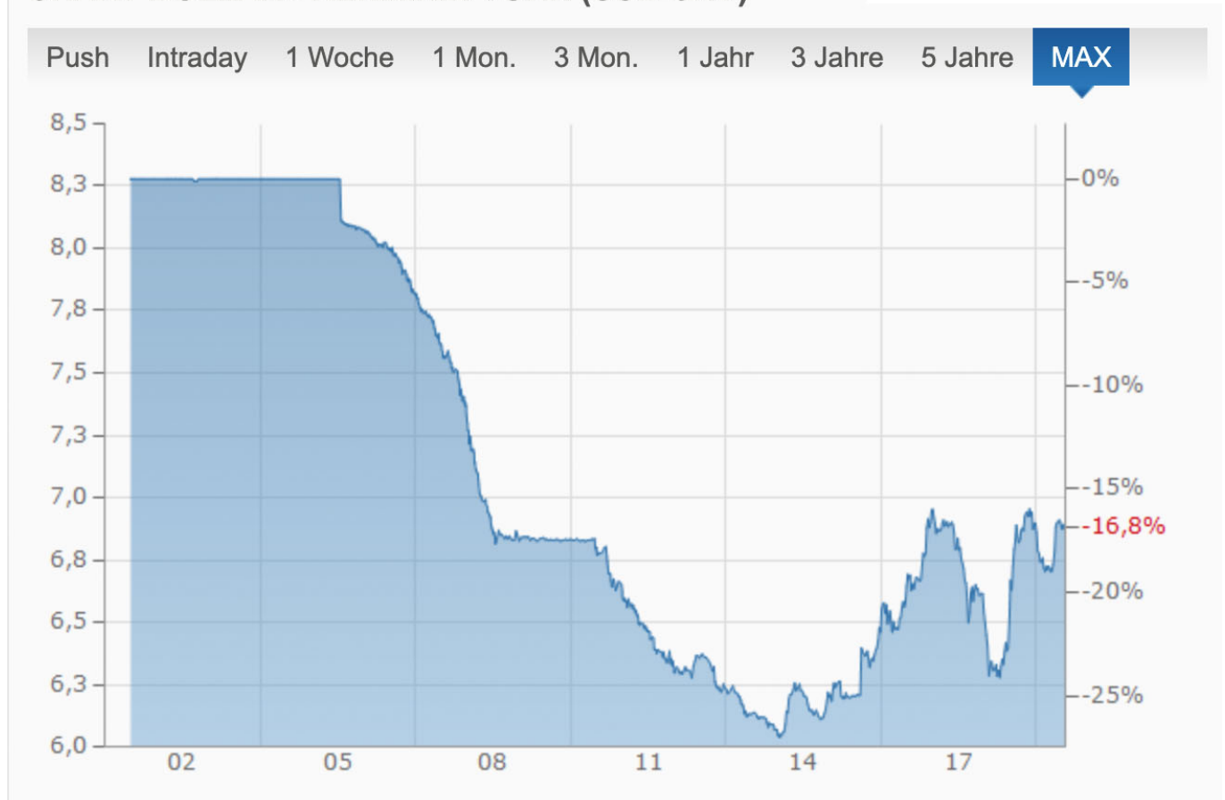
CHART DOLLAR - RENMINBI YUAN (USD-CNY)

1994 koppelte China seine Währung an den Dollar. Diese Dollarbindung verhinderte jedoch eine nötige Aufwertung des Renminbi, da sich die chinesische Volkswirtschaft ja wesentlich dynamischer entwickelte als der Dollarraum. Nach internationalen Protesten wertete China die eigene Währung daher ab 2005 in mehreren Schritten deutlich auf und koppelte sie nun an einen Währungskorb, der die internationalen Handelspartner repräsentieren soll. Problematisch ist bei solchen Koppelungen jedoch, dass sie sich in der Regel auf die nominalen Kurse, aber nicht auf die Kaufkraft der jeweiligen Währung beziehen. So wies China im letzten Jahrzehnt eine deutlich höhere Inflationsrate aus als die USA oder gar Deutschland . Wenn die Wechselkurse bei höherer Inflation im eigenen Währungsraum nominal gleich bleiben, sinkt jedoch die relative Kaufkraft. Die NZZ hat mit den Daten der Bank für Internationalen Zahlungsausgleich einmal den realen Wechselkurs der betreffenden Währungen gegenüber 60 anderen Währungsräumen visualisiert und ist zu