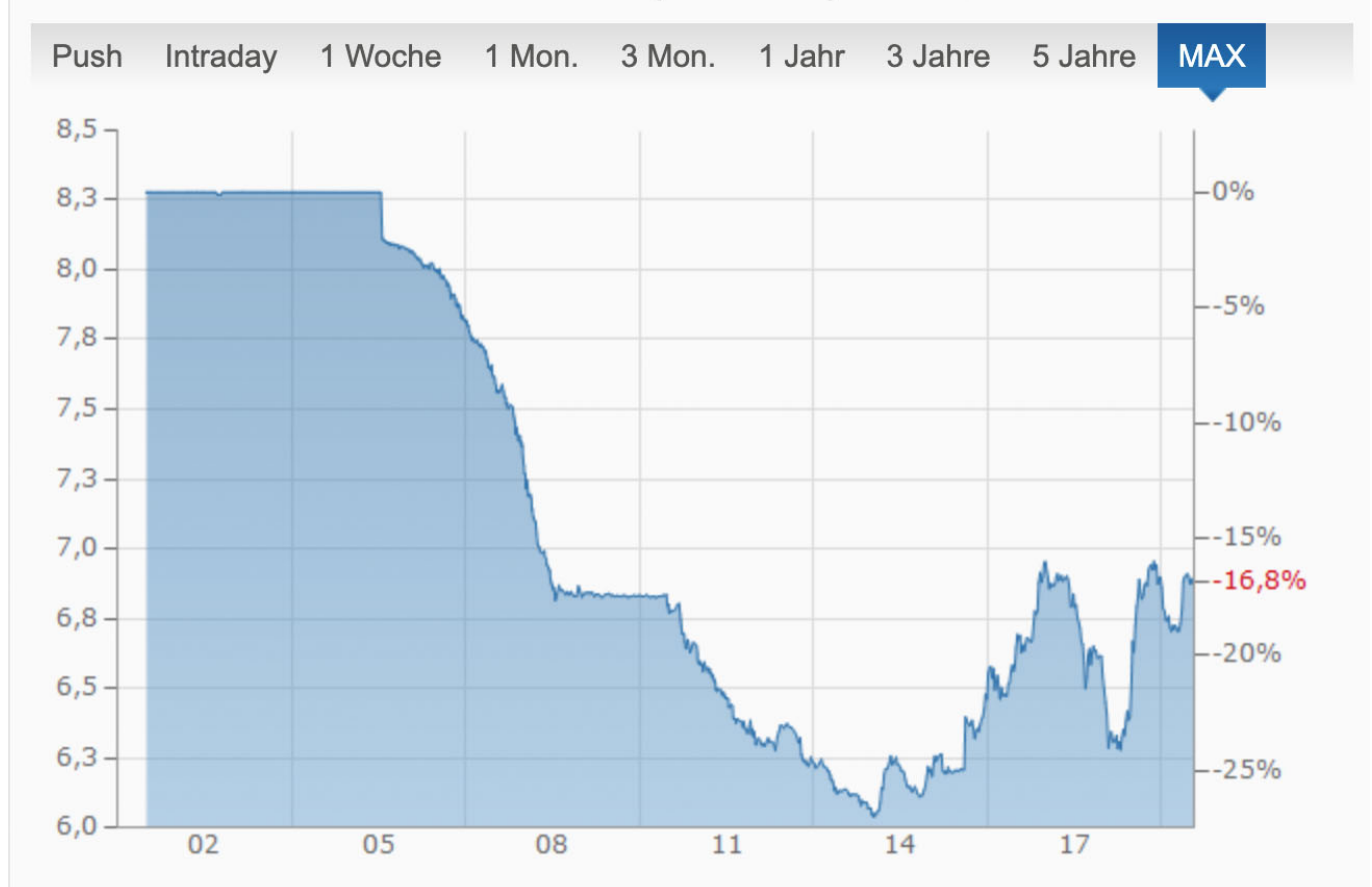
CHART DOLLAR - RENMINBI YUAN (USD-CNY)

1994 koppelte China seine Wahrung an den Dollar. Diese Dollarbindung verhinderte jedoch eine notige Aufwertung des Renminbi, da sich die chinesische Volkswirtschaft ja wesentlich dynamischer entwickelte als der Dollarraum. Nach internationalen Protesten wertete China die eigene Wahrung daher ab 2005 in mehreren Schritten deutlich auf und koppelte sie nun an einen Wahrungskorb, der die internationalen Handelspartner reprasentieren soll. Problematisch ist bei solchen Koppelungen jedoch, dass sie sich in der Regel auf die nominalen Kurse, aber nicht auf die Kaufkraft der jeweiligen Wahrung beziehen. So wies China im letzten Jahrzehnt eine deutlich hohere Inflationsrate aus als die USA oder gar Deutschland . Wenn die Wechselkurse bei hoherer Inflation im eigenen Wahrungsraum nominal gleich bleiben, sinkt jedoch die relative Kaufkraft. Die NZZ hat mit den Daten der Bank fur Internationalen Zahlungsausgleich einmal den realen Wechselkurs der betreffenden Wahrungen gegenuber 60 anderen Wahrungsraumen visualisiert und ist zu einem erstaunlichen Ergebnis gekommen.