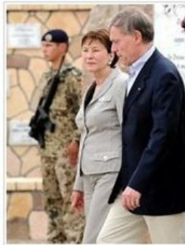
Köhler fordert mehr Respekt für deutsche Soldaten in Afghanistan

(PR-inside.com 22.05.2010 08:21:04) - Nach seinem Besuch im Feldlager Masar-i-Sharif hat Bundespräsident Horst Köhler mehr Respekt für die deutschen Soldaten in Afghanistan gefordert. «Wir brauchen einen politischen Diskurs in der Gesellschaft, wie es kommt, dass Respekt und Anerkennung zum Teil doch zu vermissen sind, obwohl die Soldaten so eine gute Arbeit machen», sagte Köhler am Samstag im Deutschlandradio Kultur.