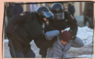
Verhaftung von Demonstrant_innen in Russland.

Kurz nach Kriegsbeginn gehen in Russland Tausende Menschen aus Protest auf die Straße. Viele Tausend dieser Aktivist_innen sollen inzwischen festgenommen worden sein. Öffentliche Proteste sind verboten. Ob die Menschen in Russland den Krieg unterstützen oder ablehnen, ist schwer einzuschätzen. Viele Menschen sind aus Russland geflohen.