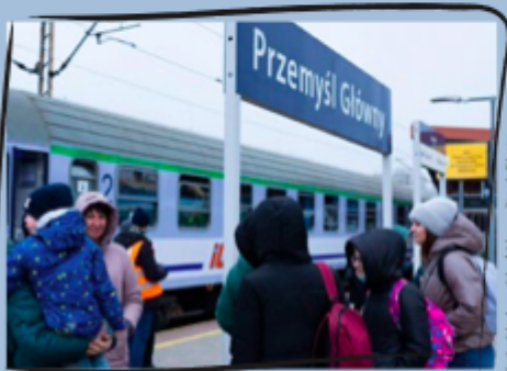
Kinder mit ihren Müttern am Bahnhof in einer polnischen Stadt. Von dort fliehen viele weiter nach Westen.

Millionen Menschen fliehen vor dem Krieg, vor allem Frauen und Kinder. Die meisten fliehen ins Nachbarland Polen. In der Ukraine gibt es nicht mehr überall genug Wasser und Lebensmittel.