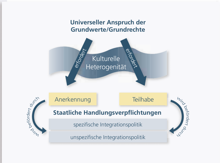
Abb. 10: Der Gedankengang von Grundwerten zu Anerkennung und Teilhabe sowie spezifischer Integrationspolitik