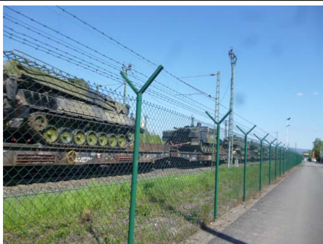
Waffentransport durch Ma-Seckenheim

„Von Mannheim aus könnten Einheiten in ganz Europa schnell mit Militärgerät beliefert werden. Die Stadt ist ein wichtiger Eisenbahnknotenpunkt, und die Coleman Barracks seien ans Schienennetz angeschlossen. Die Coleman Barracks bleiben deshalb voraussichtlich noch längere Zeit in der Hand der US-Armee. Ein Grund für die Reaktivierung des Geländes sei das derzeitige aggressive Verhalten Russlands gewesen. Deswegen hätten die USA die Entscheidung getroffen, ihre Depots für Militärgeräte in Europa aufzustocken. Man wolle für den Fall der Fälle schnell einsatzfähig sein. Zudem gehe es um Abschreckung“.