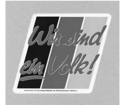
Aufkleber der CDU von 1989/1990. 2

Dass CDU und CSU die Meinungsführerschaft übernommen hatten, war schon im Dezember spürbar. So habe ich es jedenfalls empfunden: Vom 18. bis 20. Dezember tagte in Berlin der SPD-Par-