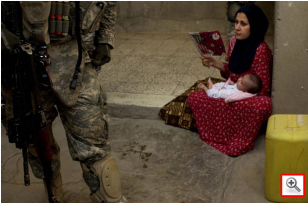
An Iraqi woman looks on as U.S. Army Soldiers from 1st Battalion, 23rd Infantry Regiment, 3rd Stryker Brigade Combat Team search the courtyard of her house during a cordon and search in Ameriyah, Iraq, May 14, 2007.

an eine Million Menschen durch den Krieg umgekommen waren fast ausgelacht. Das Fernsehen und die gängigen Zeitungen sprachen damals von etwa 10.000 bis 100.000 Todesopfern im Irak. Man brauchte allerdings keine drei Stunden Recherche und ein bisschen Erfahrung im Umgang mit Kriegsberichten, Zahlen und Statistiken, um zu erahnen, dass die wirkliche Anzahl der Opfer viel höher war.